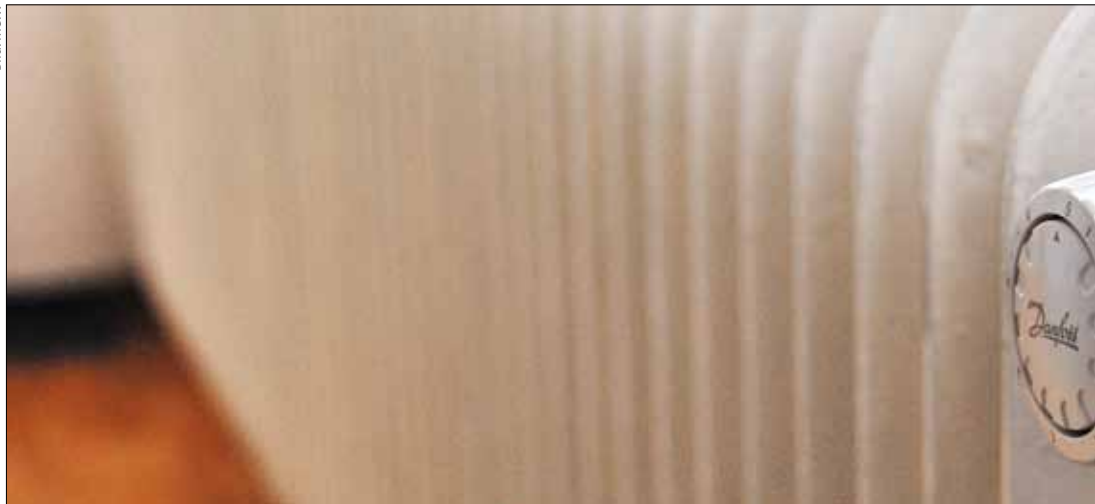
Ist der Heizungsregler richtig eingestellt? In dieser Jahreszeit muss die Stube warm sein.

liche Hinterlegung des Mietzinses Druck auf den Vermieter auszuüben. Lassen Sie sich dabei vom MV über das genaue Vorgehen beraten. Auf der Verbandswebsite www.mieterverband.ch finden Sie ebenfalls Tipps und Musterbriefe dazu. Grundsätzlich müssen Sie dem Vermieter zuerst eine Frist setzen und die Hinterlegung androhen.