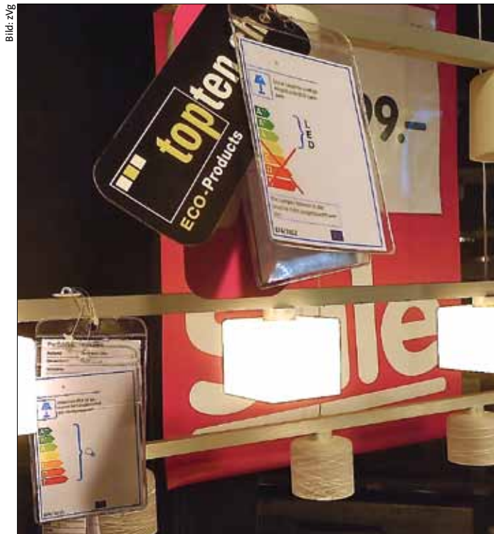
LED-Leuchten findet man heute in vielen Geschäften.