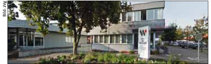
Die Zentrale der Wirtschaftskammer Baselland – auch eine Filzzentrale?

Der MV hat diesen Filz stets kritisiert. So beim mittlerweile gebodigten «Baselbieter Erfolgsmodell», bei dem mittels rekordtiefer Eigenmietwerte und Gesetzes-