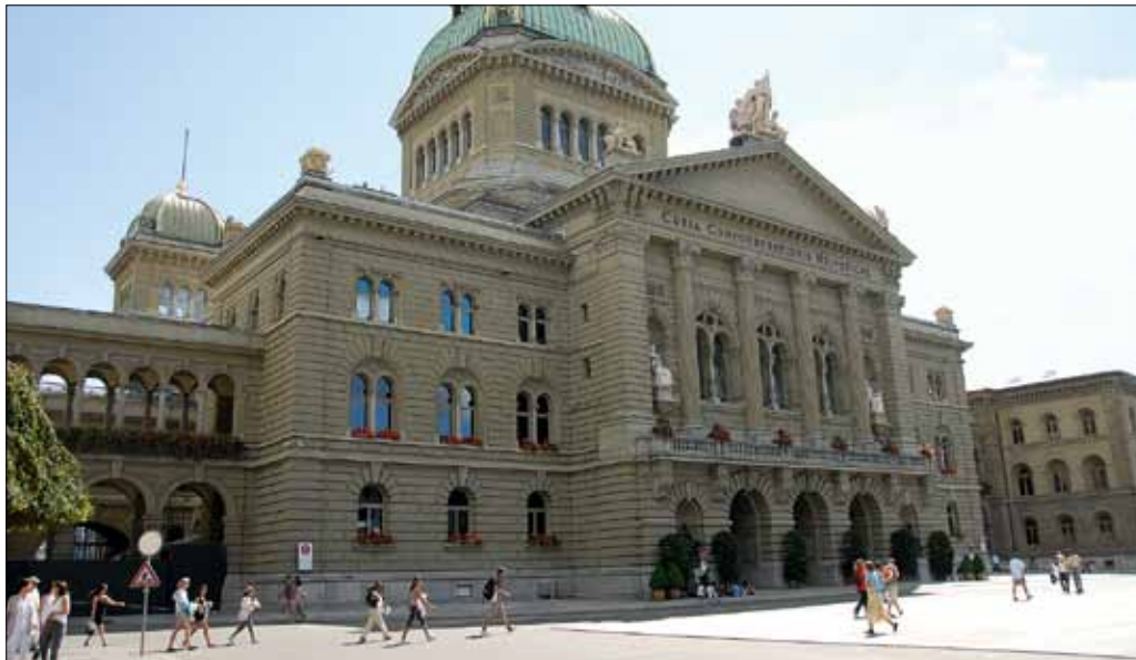
Für die Mieteranliegen brechen im Bundeshaus schwere Zeiten an.

Für die Mieteranliegen heisst das, dass das Klima frostiger wird. Die mieterfreundlichen Parteien links der Mitte sind schwächer als vorher. SVP und FDP vertreten die Eigentümerinteressen und haben für Mieterpolitik wenig übrig. Ob die Mitte mieterpolitisch mitzieht oder blockiert, wird sich (wie schon bisher) von Fall zu Fall weisen müssen. Politische Fortschritte für die Mietenden durchzusetzen wird auf jeden Fall schwieriger. Das wird schon bald konkret spürbar sein: Die bundesrätliche Vorlage über die Transparenz der Vormiete wird es schwer haben. Ob die