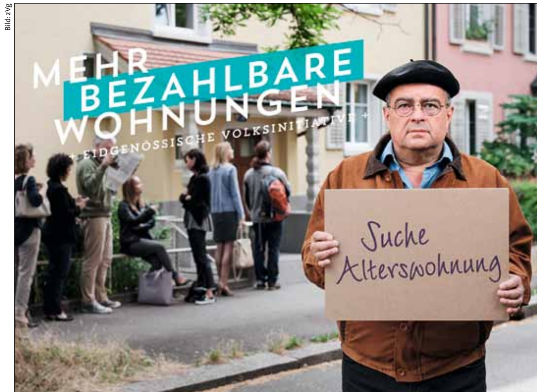
Alte und Junge brauchen vier Wände. Die MV-Wohn-Initiative will für mehr günstige Wohnungen sorgen.

Neben dem klassischen Unterschriftenbogen kommt auch ein so genannter «eCollector» als Kampagnen- und Sammelplattform