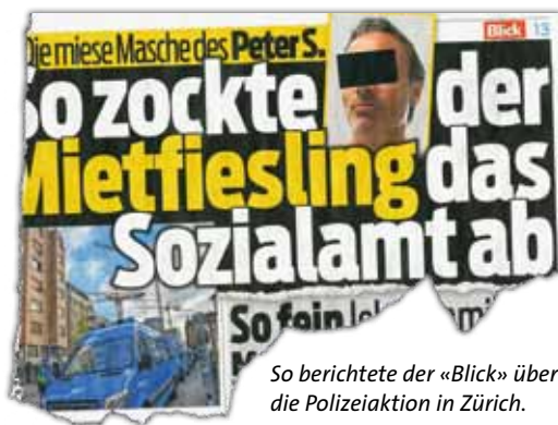
So berichtete der «Blick» über die Polizeiaktion in Zürich.

Haben Sie Mietprobleme? MV HOTLINE 0900 900800 (CHF 3.70/Min., aus dem Festnetz)