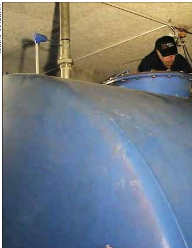
Ein Hauswart muss vieles können (S. 8).