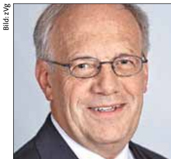
Bundesrat Johann Schneider-Ammann kann mit Mieteranliegen nicht viel anfangen.

Auch die Milliardenbeträge, welche die Vermieter durch die Nichtweitergabe der Senkungen in die eigene Tasche stecken, kümmern den Bundesrat nicht. Jedenfalls sträubt er sich dagegen, dieses Problem eingehend zu untersuchen, wie dies Balthasar Glättli fordert. Es fehlten dazu verlässliche Daten, so sein Argument. Das überzeugt allerdings wenig. Glättli selber schätzt, dass die Vermieter zwischen 2008 und 2015 rund 14 Milliarden Franken Zinszahlungen eingespart haben – auf Kosten der Mietenden, die zu viel zahlen.