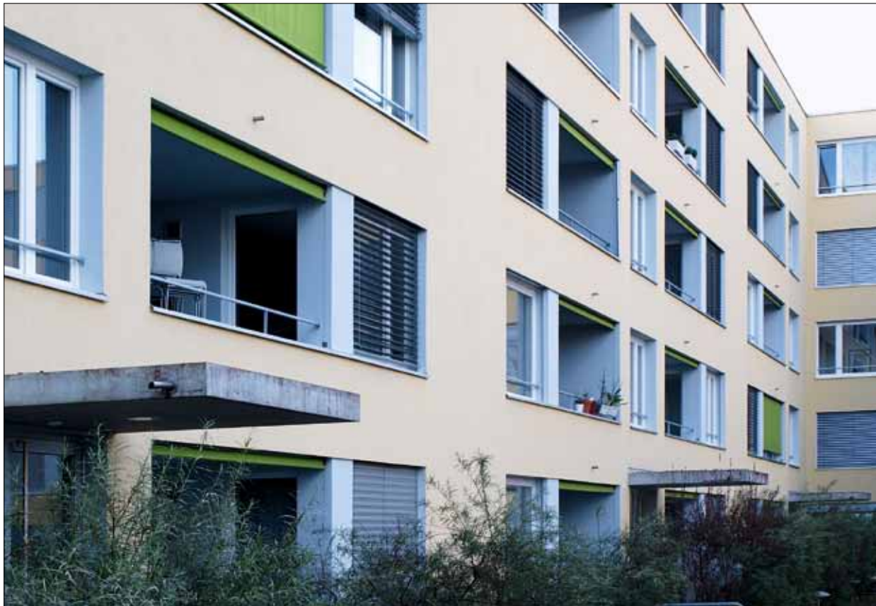
Dieses Wohnhaus in Kaiseraugst wurde den künftigen Mieterinnen und Mietern mit Minergie angepriesen. Doch es war gar keine Minergie drin.

des Minergie-Standards erfüllen. Aufgrund dieser Ungereimtheiten wandten sich die skeptisch gestimmten Mieterinnen und Mieter nochmals an die Livit.