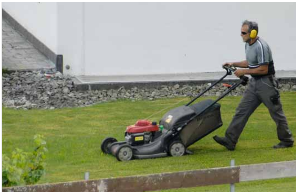
Der Hauswart macht zwar manchmal Lärm, aber ohne ihn geht es einfach nicht.