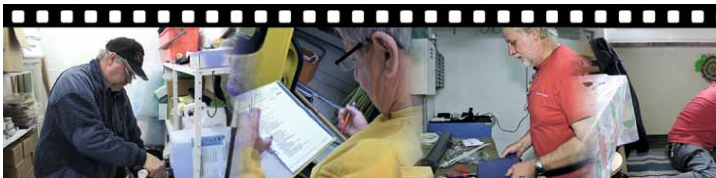
Momentaufnahmen aus der Videodokumentation «Hauswartung». Man kann den 41minütigen Film im Internet ansehen (siehe Box).