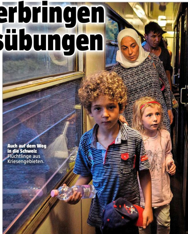
Auch auf dem Weg in die Schweiz Flüchtlinge aus Krisengebieten.

«Der Kanton betreibt Pflasterli-Politik.»