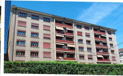
Sind laut dem MV Basel bezugsbereit Leere Immobilien beim Messeplatz.