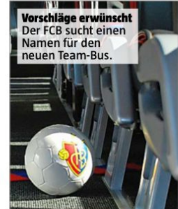
Vorschläge erwünscht Der FCB sucht einen Namen für den neuen Team-Bus.

«Im neuen rotblauen Bus wird unser Team inskünftig ebenso gut sichtbar wie bequem und sicher durch die Schweiz und Europa reisen», sagt FCB-Präsident Bernhard Heusler.