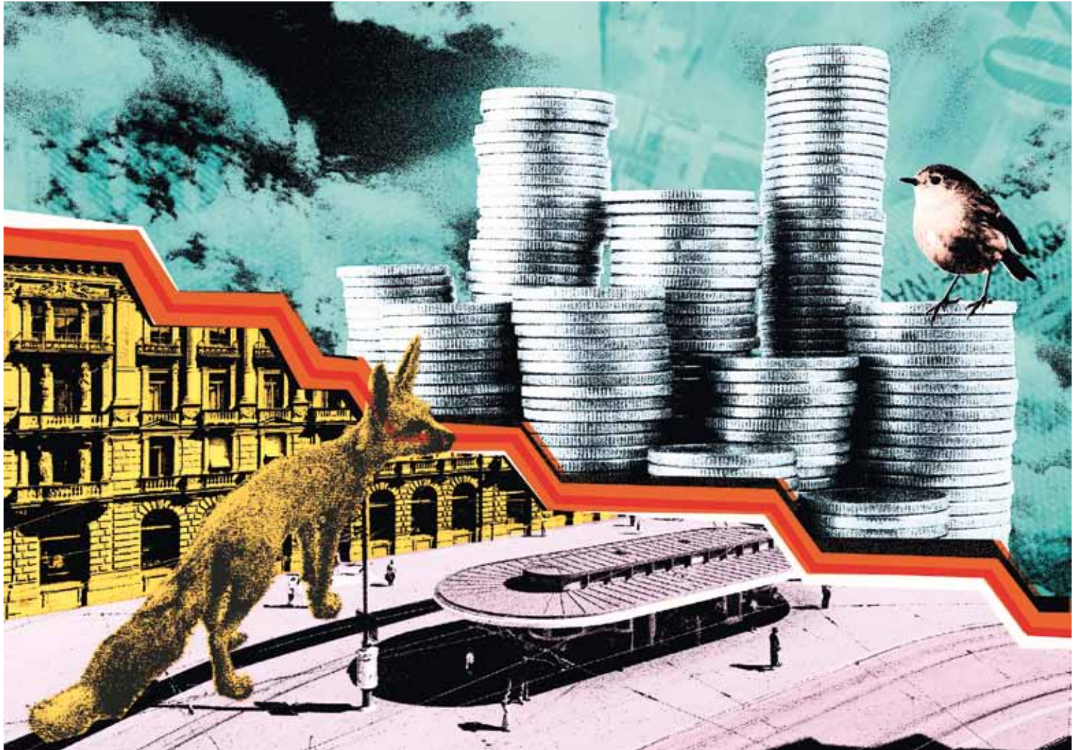
Der schlaue Fuchs spart bei einer Zinssenkung Geld!