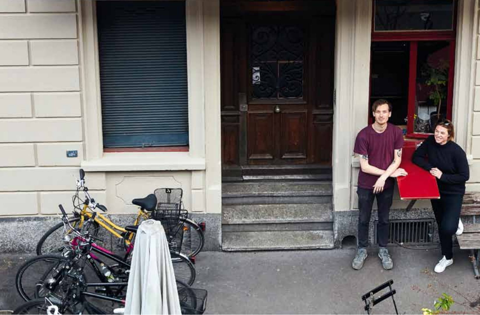
Sie haben bewiesen, dass eine Hausgenossenschaft auch im Zürcher Zentrum noch möglich ist.