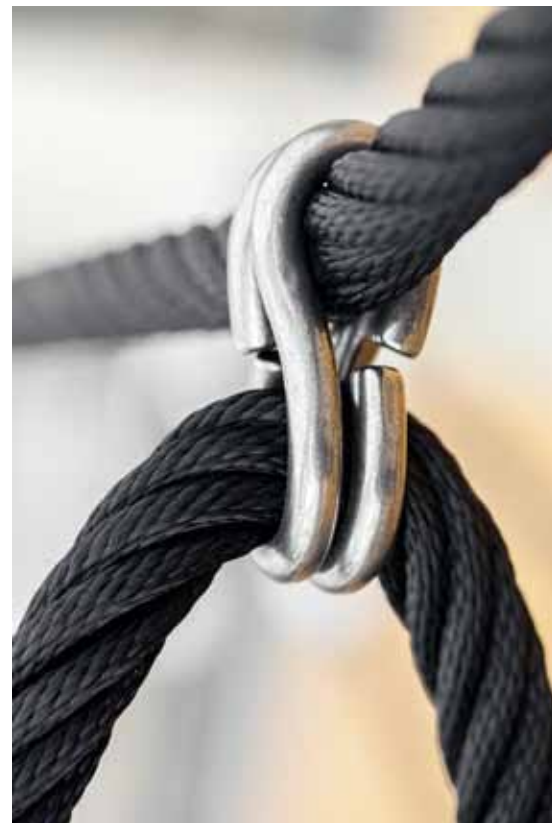
Im Kanton Baselland prägen gut verknottete Seilschaften die Politszene.

Der Kanton muss endlich das Wohnproblem wahrnehmen. Er muss dem Wohnen als Grundbedürfnis viel stärker Rechnung tragen und Lösungen gegen die steigenden Mieten suchen. Man könnte etwa eine Offensive für