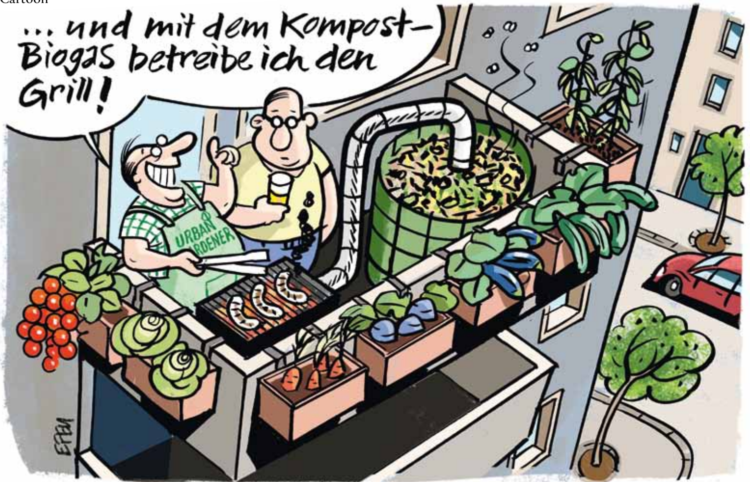
Efeu zum Thema Urban Gardening