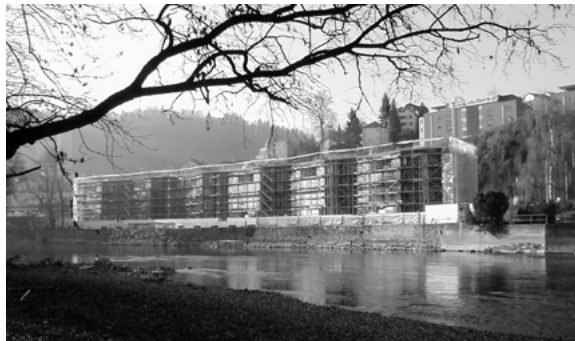
Wohnbauoffensive Luzern West: Leben an der Reuss

Im Jahr 2005 wurden durch unsere Rechtsberaterinnen und -berater 1179 Mitglieder persönlich beraten. Mängel in der Wohnung sowie die Heiz- und Nebenkosten sind nach wie vor Spitzenreiter bei den Problemfällen.