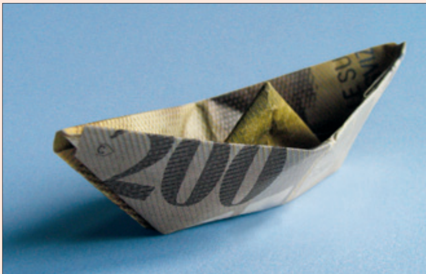
Manche Mietkaution entpuppt sich nach Jahrzehnten als verlorenes Geld.

den, dürfte aber noch schwieriger sein. Immerhin könnten Sie es versuchen. Hopfen und Malz verloren sind allerdings, wenn Sie nicht einmal eine Quittung