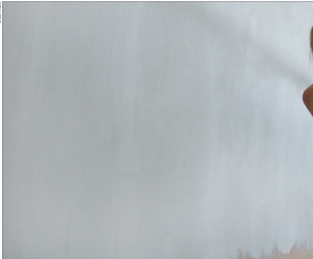
Wer in der Wohnung selber Hand anlegt, sollte sich vorher absichern. Sonst kann viel Geld verloren gehen.