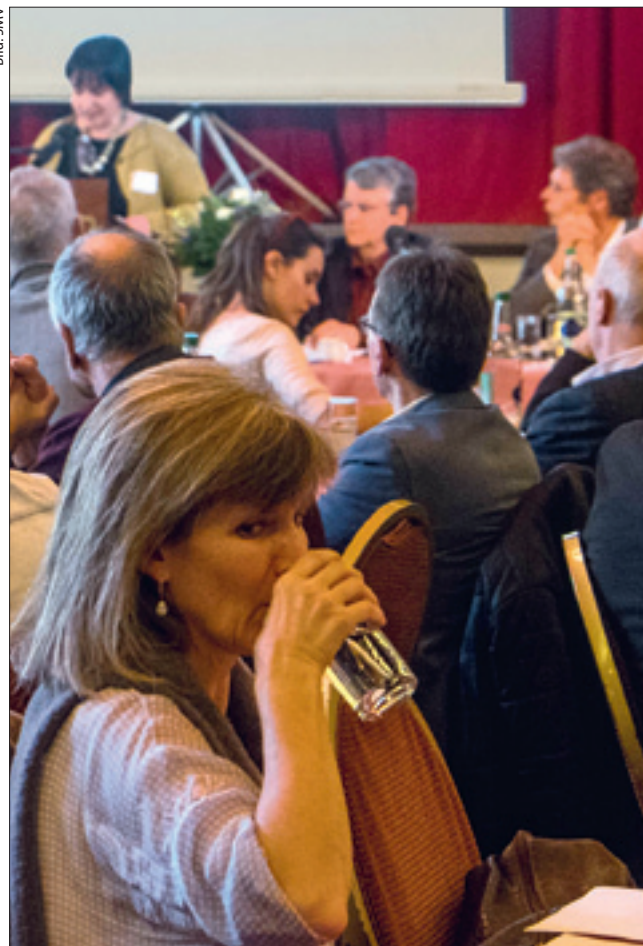
Die Tagung des SMV «Gemeinsam für mehr zahlbaren Wohnraum» lockte viele Interessierte nach Bern (S. 4 und 5).

Herausgeber: Mieterinnen- und Mieterverband Deutschschweiz Redaktion: Ralph Hug (rh), Pressebüro St.Gallen, Postfach 942, 9001 St.Gallen, Tel. 071 222 54 11 Administration und Adressverwaltung: M&W, Postfach 2271, 8026 Zürich, Tel. 043 243 40 40, Fax 043 243 40 41 info@mieterverband.ch, www.mieterverband.ch Ständige Mitarbeiter/innen: Ruedi Spöndlin (rs), Basel; Michael Töngi, Bern; Balthasar Glättli, Zürich; Beat Leuthardt, Basel; Urs Thrier, Basel; Walter Angst, Zürich Layout: Hannah Traber, St.Gallen Druck: Stämpfli AG, Bern Beglaubigte Auflage: 119'408 Exemplare Erscheinen: 9 mal pro Jahr Abonnementspreis: Fr. 40.-/Jahr Inserate und Beilagen: Judith Joss, judith.joss@mieterverband.ch Tel. 043 243 40 40