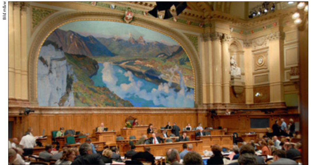
Im Nationalrat führen die Vertreter der Hauseigentümerinteressen wieder einmal gross auf.

Trotz allem sind Steuerabzüge in bürgerlichen Kreisen hoch im Kurs. Vielleicht ist dies auch gewollt: Denn von den Steuerabzügen profitiert man umso mehr,