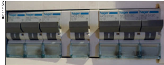
Ob Sicherungskasten oder Systemsteuerung: Ohne Strom funktioniert beides nicht.