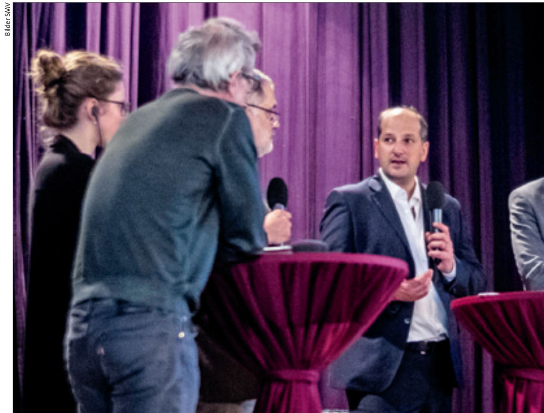
Die Botschaft der Fachleute an der SMV-Tagung war klar: Ohne eine stärkere Förderung des gemeinnützigen Wohnbaus ge

nicht realisieren können.» Die Gemeinde leistete dabei die Anschubfinanzierung, indem sie ein befristet zinsloses Darlehen sowie darüberhinaus auch steuerliche Anreize bot. Zudem profitierte die Genossenschaft von Finanzhilfen durch den Dachverband «wohnbaugenossen-