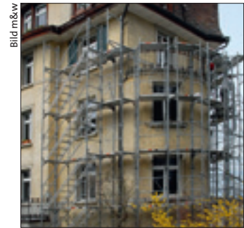
Eine Sanierung muss konkret sein, damit Kündigungen rechters sind.

→ Urteil vom 9. Februar 2016 (BGer 4A_327/2015)