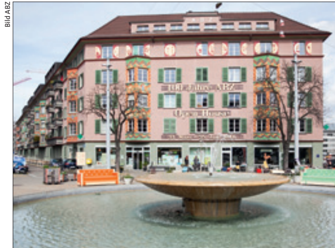
Zürich grösste Baugenossenschaft feiert mit einer farbenfrohen Ausstellung in der Siedlung Sihlfeld am Bullingerplatz Geburtstag.

Es war mitten im Ersten Weltkrieg. Am Sonntag, 30. Juni 1916 trafen sich fünfzehn Männer im Rest. Strauss an der Ecke Militär/Langstrasse in Zürich und gründeten die Allgemeine Baugenossenschaft Zürich (ABZ). Die Gründer waren von einer neuen Welt beseelt und hatten Revolutionäres vor. Sie wollten sich vom Kapitalismus verabschieden, insbesondere von der Ausbeutung durch Wohnungsbesitzer, die überrissene Mieten verlangten. Vor allem Arbeiterfamilien mit geringem Lohn sollten von der neuen gemeinnützigen Baugenossenschaft profitieren. «Allgemein» hiess sie, weil man sich nicht auf bestimmte Berufe be-