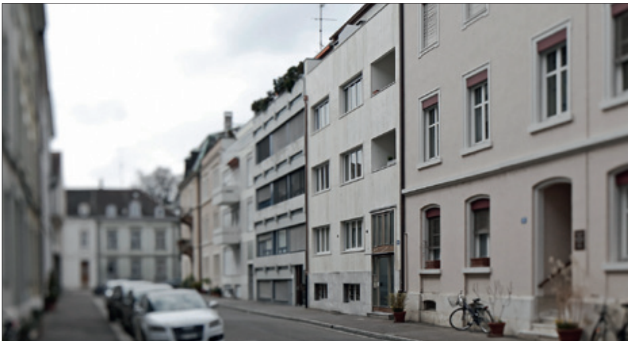
Die gekündigten Mieter in diesem Basler Quartier holten eine selten lange Mieterstreckung heraus.

schub gewährt. Auch bei älteren Betroffenen sei es nicht leicht, einen längeren Aufschub zu erhalten, sagt Leuthardt aus Erfahrung. Dies obwohl es in Basel immer schwieriger werde, eine bezahlbare Wohnung zu finden. Leuthardt erinnert an zwei unruhliche Tiefpunkte aus der Basler Schlichtungspraxis.