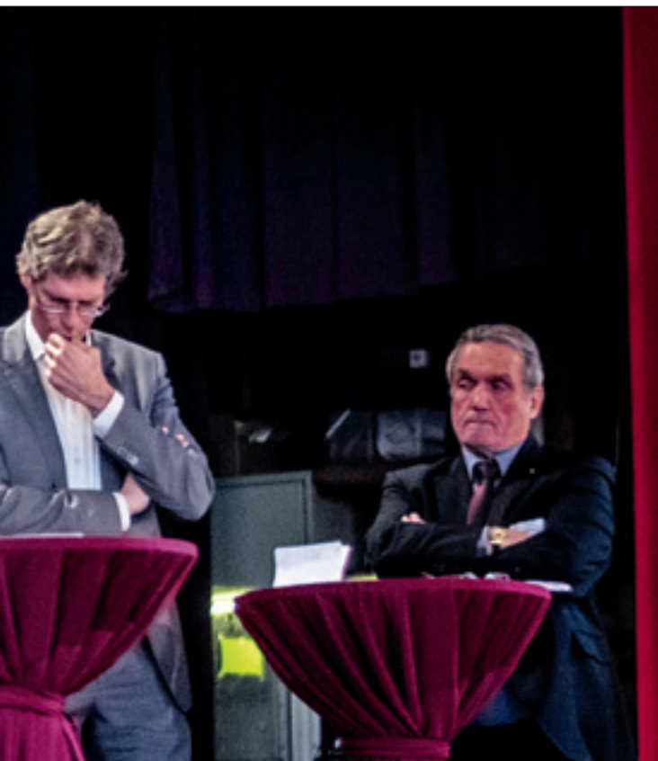
ht es nicht.

kannt, dass der Markt allein niemals die grosse Nachfrage decken könne. Daher habe sich die Stadt seit langem engagiert. Und sie hat grosse Pläne: Oberhalb von Lausanne soll ein Öko-Quartier für 3000 Leute entstehen, die Planung dafür ist im Gang.