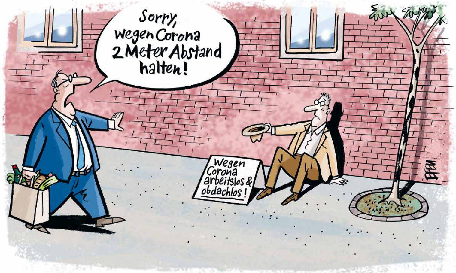
Efeu zum Thema Zahlungsverzug wegen des Corona-Lockdowns.